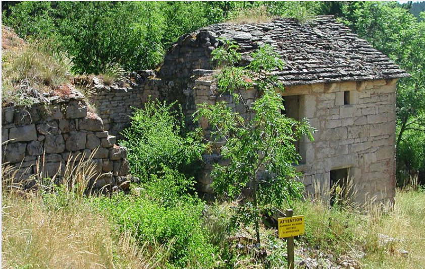
Hameau abandonné de la Chaumette