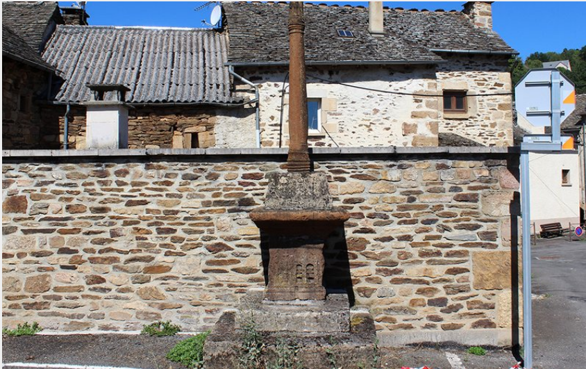
Croix remarquable à Badaroux