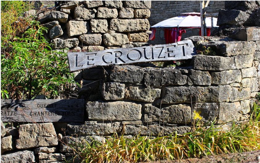
Hameau du Crouzet (Chastel-Nouvel - 48)