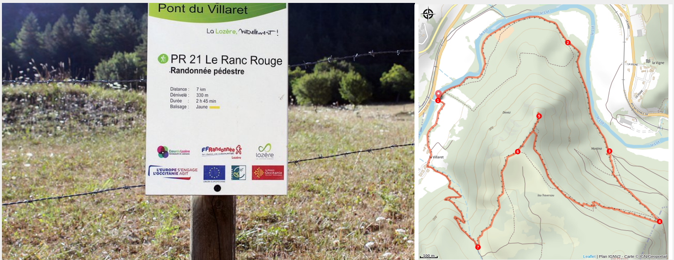
Panneau départ du sentier Ranc Rouge

Ce circuit, au départ du pont du Villaret, vous fera remonter le long du Lot sur sa rive gauche avant de grimper sur un éperon du Causse de Sauveterre dominé par le "Ranc rouge". Cette déformation du mot occitan "ronc" signifie "rocher" : ici, le calcaire est teinté de rougeâtre par des oxydes de fer. De ce point haut, la vue embrasse la vallée du Lot et la Margeride. En chemin, la fontaine de Saint-Véran évoque le premier emplacement du village de Barjac.