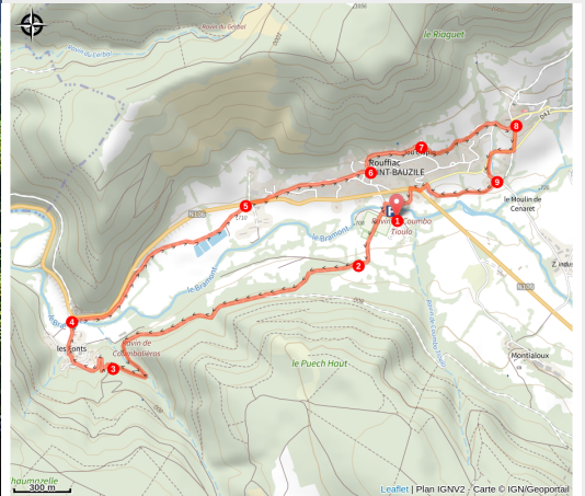
Chemin de randonnée après le village des Fonts

Cet itinéraire court le long du Bramont et de ses affluents dont la Nize. Vous y découvrirez la façon dont nos anciens ont domestiqué la force des rivières grâce au vieux moulin de Cénaret et au système du "béliet hydraulique" au village des Fonts ("les Fontaines" en occitan).